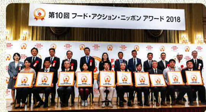
※昨年会場イメージ